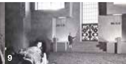
1-3: Vom Bauen der Zukunft – 100 Jahre Bauhaus 4-5: Bauhausfrauen 6-7: Max Bill – Das absolute Augenmaß 8-9: L'Inhumaine