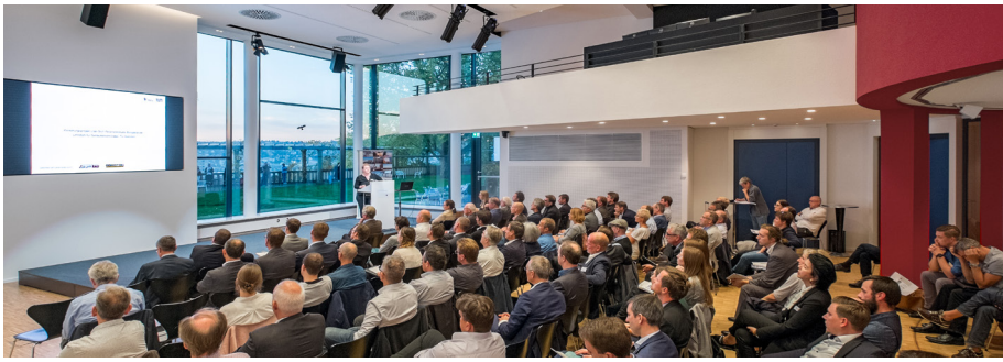
17. Deutscher Fassadentag ® in Stuttgart

Fachverband Baustoffe und Bauteile für vorgehängte hinterlüftete Fassaden e.V. – FVHF Kurfürstenstraße 129, 10785 Berlin, Tel. 030 212862-81 E-Mail: info@fvhf.de , www.fvhf.de